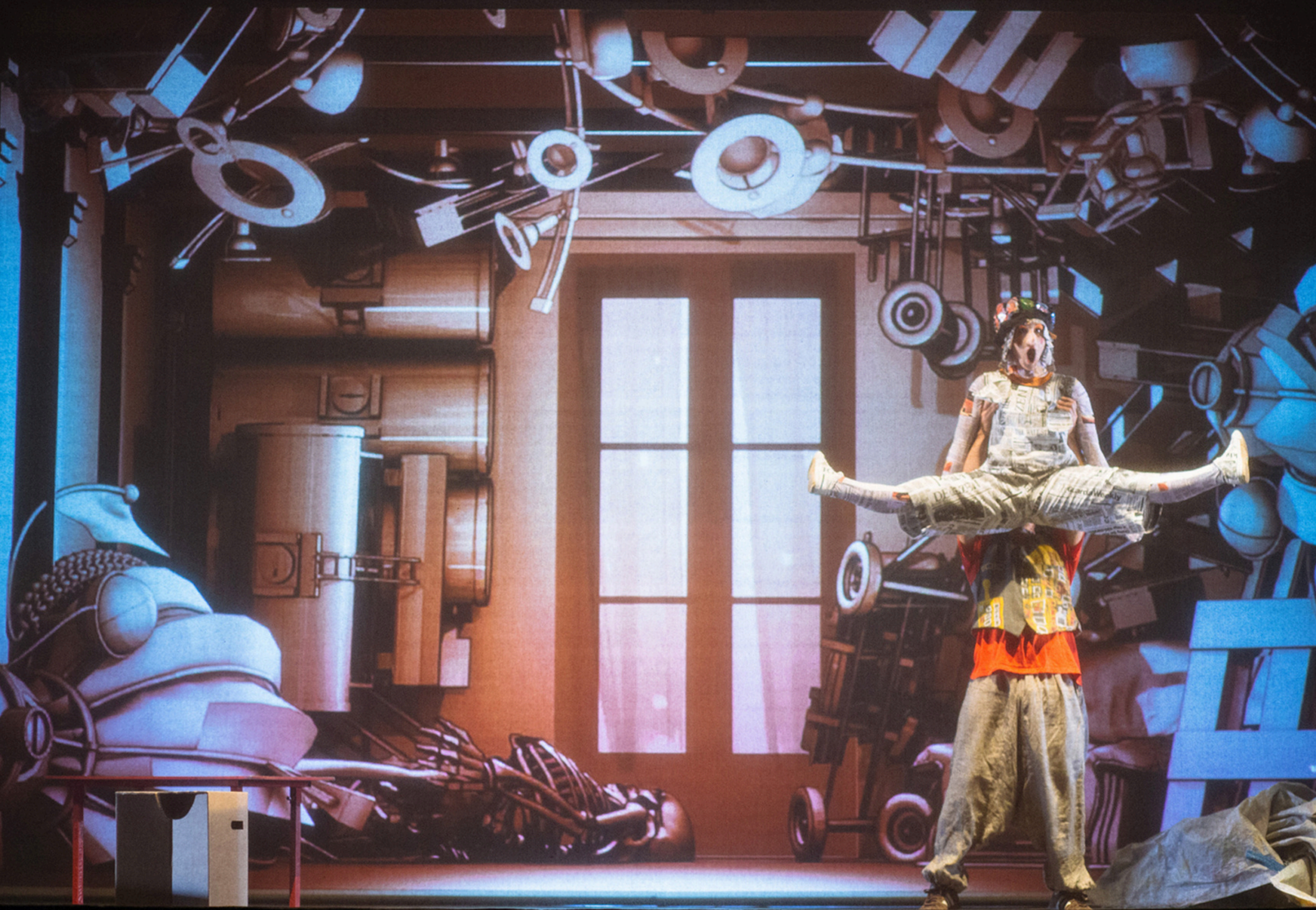
photographies de la version du spectacle de 2010.